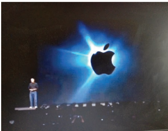
Your life in your iPhone : it's a revolution. (Steve Jobs présentant l'iPhone en 2007)

Son éthique consistait à ne pas travailler pour des clients dont il désapprouvait moralement les affaires. Il n'a jamais travaillé pour des vendeurs d'alcool, par exemple. En revanche, travailler pour Lucky Strike, alors qu'il connaissait les dangers du tabac (dès les années 1920, il avait reçu des rapports de scientifiques allemands sur le cancer du poumon), n'avait pas l'air de s'opposer à ses règles d'éthique... Même s'il n'aimait pas que sa femme fume. Sur ce dernier point, Bernays était comme Steve Jobs, le créateur d'Apple, qui interdisait à ses enfants l'usage de la technologie à la maison, et avait choisi pour eux une école sans technologie.