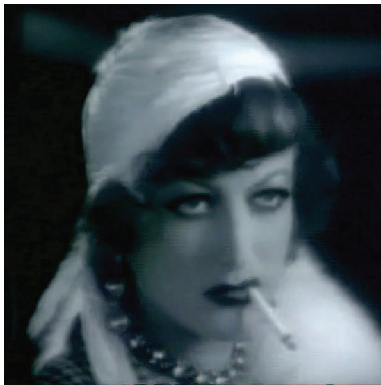
La cigarette au cinéma (ici Joan Crawford)