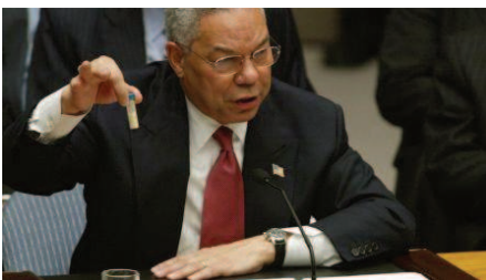
Colin Powell affirmant que l'Irak détient des armes de destruction massive – 2003

La United Fruit Company , qui domine le marché de la banane dans toute l'Amérique Latine, a été expropriée du Guatemala, qui vient d'élire un socialiste à sa Présidence. La compagnie bananière organise alors, avec l'aide de la CIA, un coup d'Etat , en vue duquel Bernays va travailler l'opinion publique. Nous sommes en pleine guerre froide, et l'idée est de faire croire aux américains que le Guatemala a été infiltré par les bolchéviques.